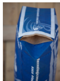
Evolució Mercat Bosses SOS