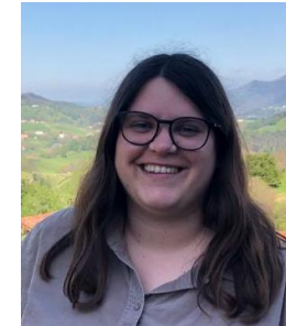
Aina Sospedra Gestió Respon.cat