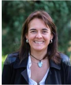
Marta Ribera Comunicació Respon.cat Consultora RSE.Pime