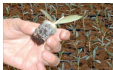
Paperpot: suport biodegradable

Han iniciat una nova línia d'activitat, la producció de biomassa, amb l'entrada a producció d'un tipus d'arbre amb baixa necessitat hídrica.